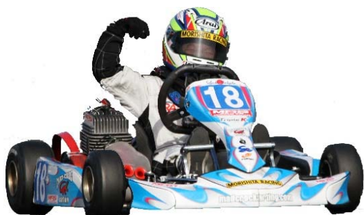
YAMAHA CADET OPEN